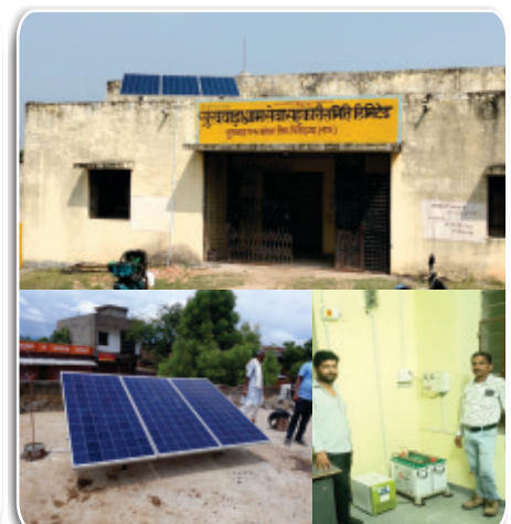
SPV Power Plant at Cooperative Bank