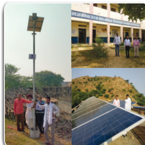
PFC CSR Project at Sawai Madhopur (Rajasthan) executed by REIL