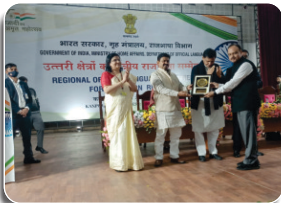
दिनांक 27.11.2021 को नराकास ( उपक्रम ) जयपुर को वर्ष 2019-20 हेतु "क" क्षेत्र में नराकास की श्रेणी में प्रथम पुरस्कार

On this occasion, MD said that every industry should strengthen its Employee and Employer relationship so that a best industrial environment can be created.