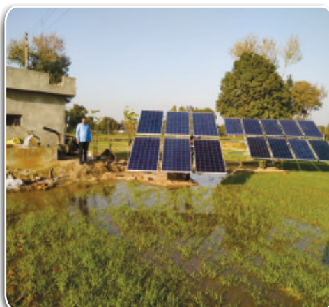
5 HP SPV Water Pumping System installed in J&K under Kusum Scheme at village Barnoti, J&K