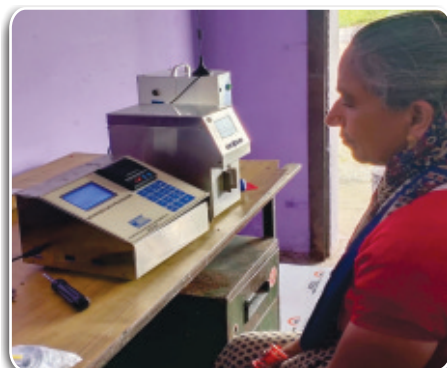
Milk Collection at Society Nandpur Kalayanpur (Nainital)

Few orders for Electronic Milk Adulteration Tester with Milk Analyzer from Northern Region were received through GeM Portal of GoI.