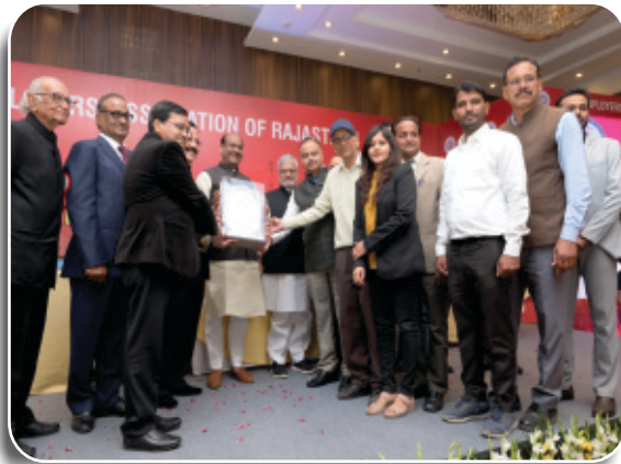
Best Employer Award 2021 on 14.11.2021